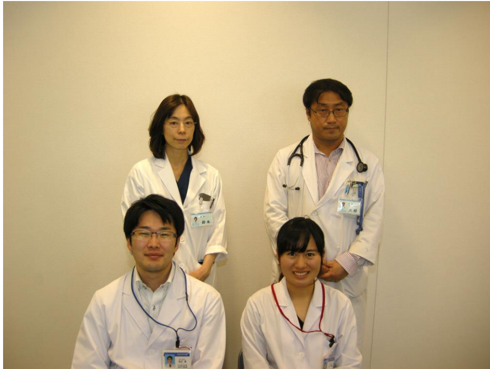
実習最終日の記念写真