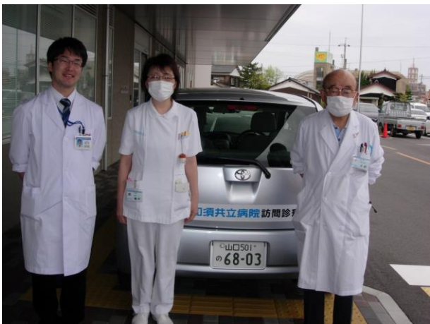
院長の訪問診療同行①