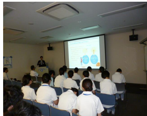
勉強会に参加。ストーマケアのお話でした。