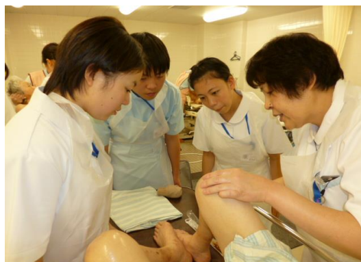
処置の方法を教えてもらっています。