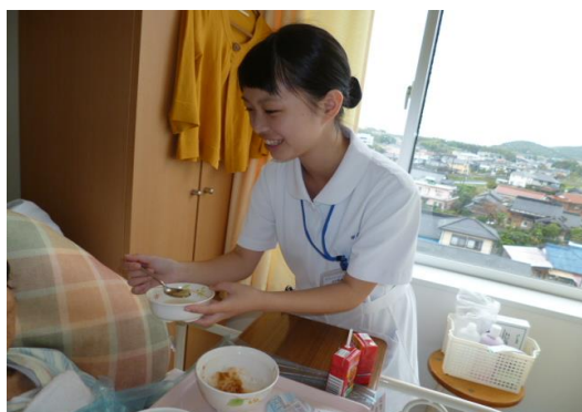
笑顔で食事介助しています。