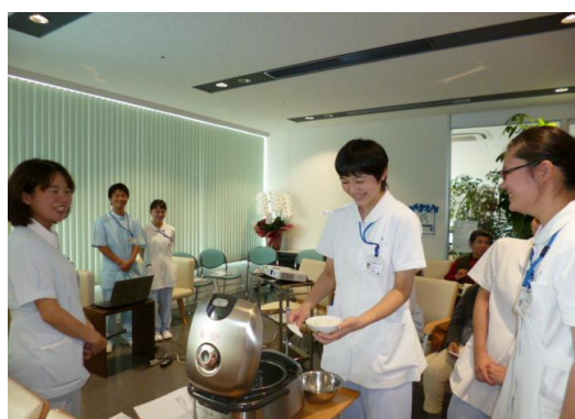
週1回の糖尿病教室です。