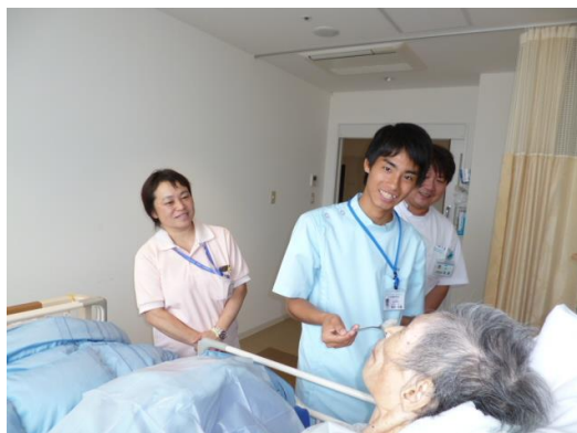
スタッフに見守られての食事介助です。