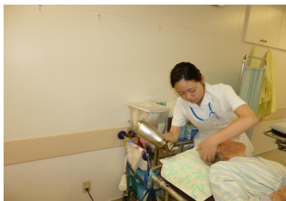
髪を乾かしています。気持ちいいですか。