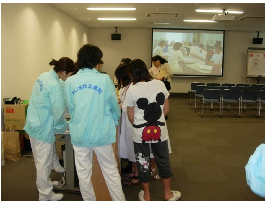
ナースの1日ビデオ放映