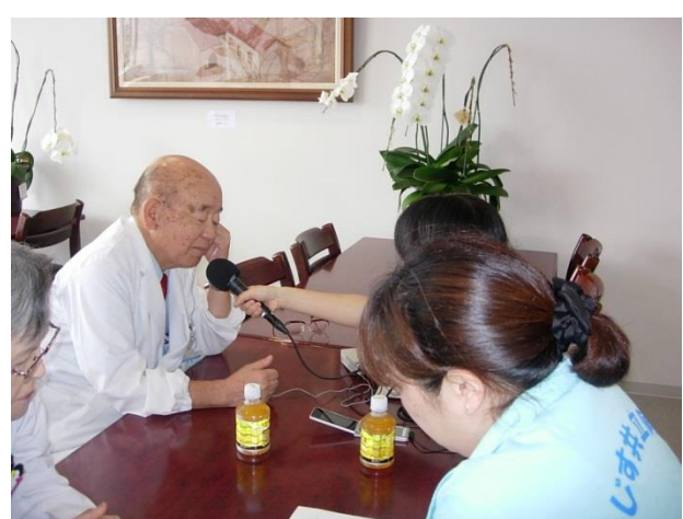
FM きららレポート放送 (三好病院長)