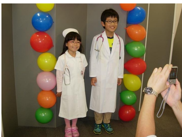
将来の医師、看護師かな？