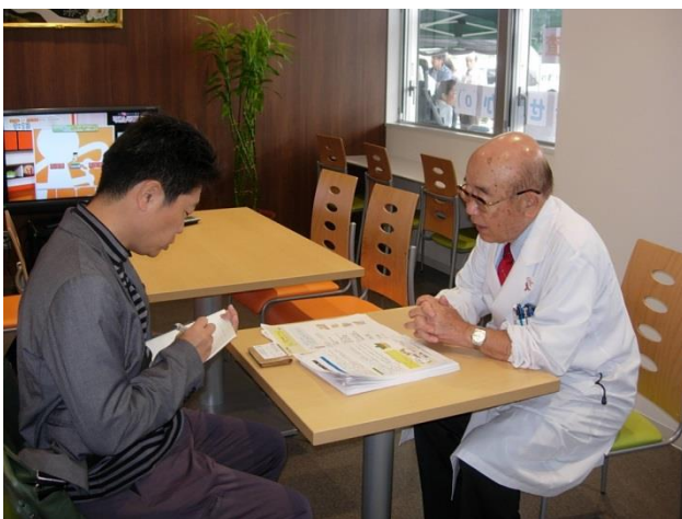
宇部日報の取材風景