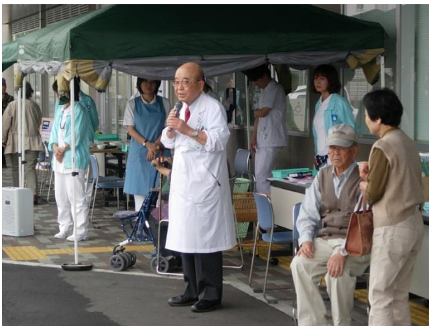
イベント開始直前