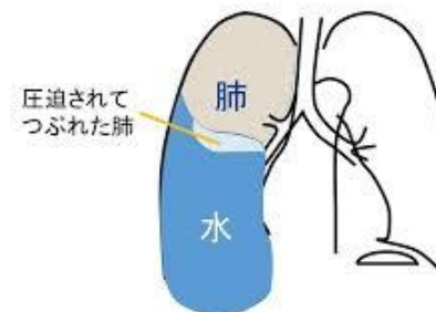
<図2 水がたまると❁症状が出る>