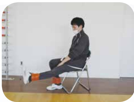
膝を伸ばす運動 (膝関節の伸展運動)