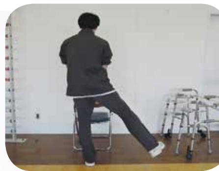
足を横に開く運動 (股関節の外転運動)