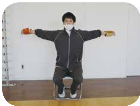
手を横に開く運動 (肩関節の外転運動)